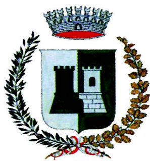
COMUNE DI CASTELNUOVO