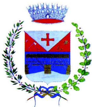
COMUNE DI CARZANO