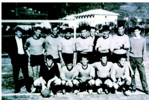
Lavis 2 ottobre 1966: Garibaldina - Telve, 6 a 1