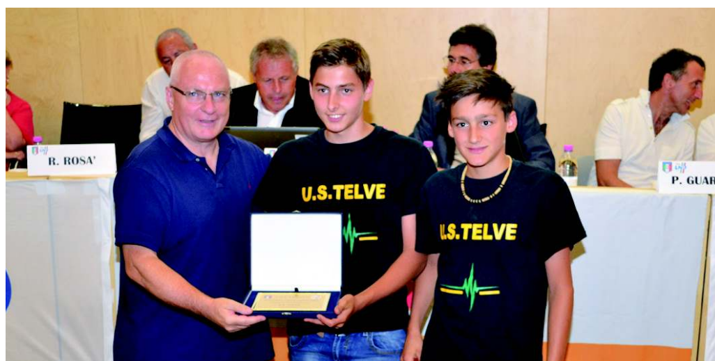
Consegna della targa "Premio disciplina" alla squadra Allievi "Provinciali" dell'U.S. Telve