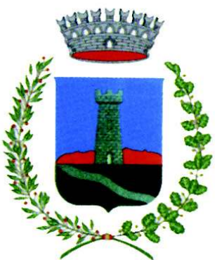
COMUNE DI TORCEGNO