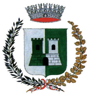
COMUNE DI CASTELNUOVO