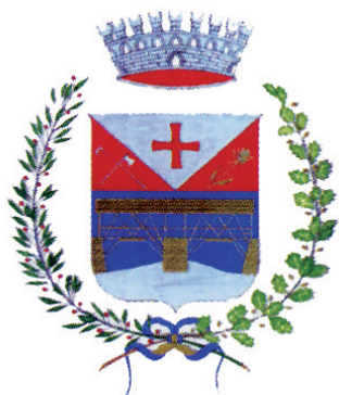
COMUNE DI CARZANO