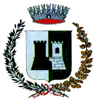
COMUNE DI CASTELNUOVO