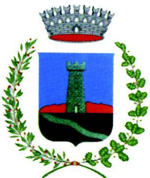
COMUNE DI TORCEGNO